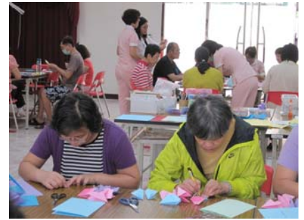
圖：病友們專注製作卡片實景