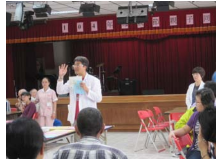
圖：工作人員說明活動內容實況

活動終於進入了尾聲，若家人有事無法前來，本院也將替病友寄出卡片，及時傳達滿滿的愛到家人手中，祝福天下的媽媽們，母親節快樂，病友有家屬們的陪伴，在復健之路上並不孤單，且能成爲堅強的後盾。(文/許家綺心理師)