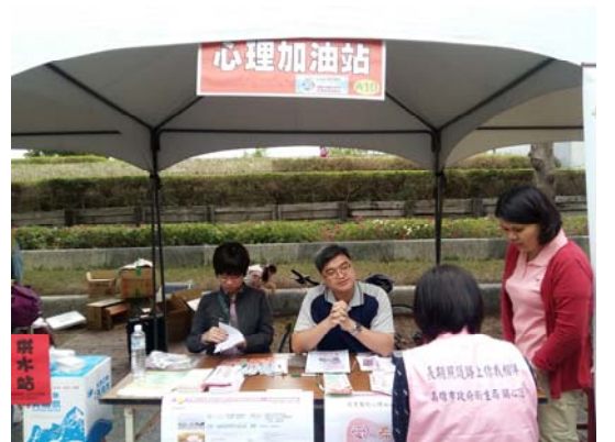
圖：由臨床心理科設置的「心理加油站」會場實況