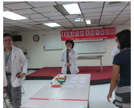
圖：繪龍舟比賽得獎作品出爐囉