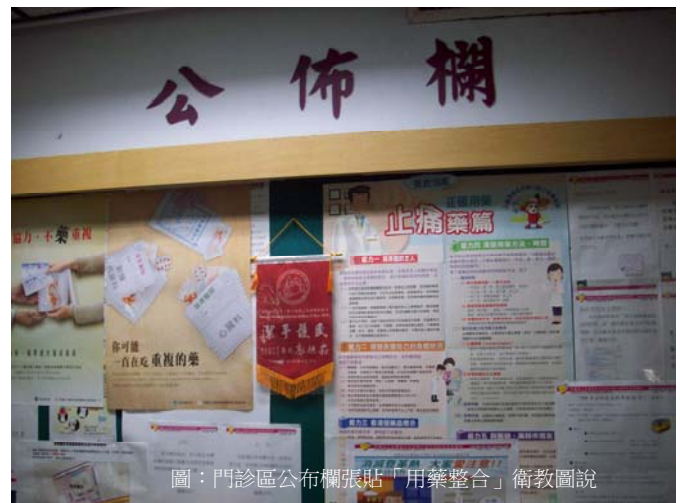
圖：門診區公佈欄張貼「用藥整合」衛教圖說