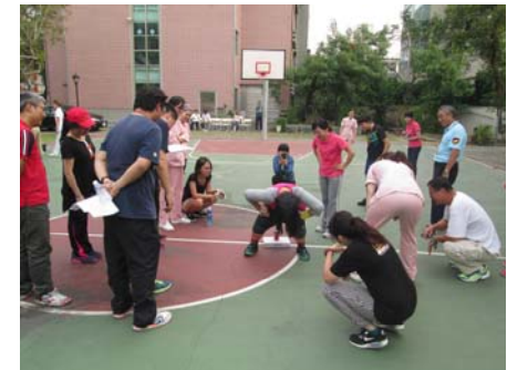
圖：趣味競賽”誰的尾巴最厲害”比賽實況