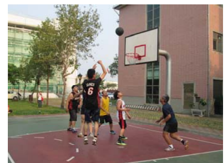
圖：三對三籃球賽男子組精彩比賽實況