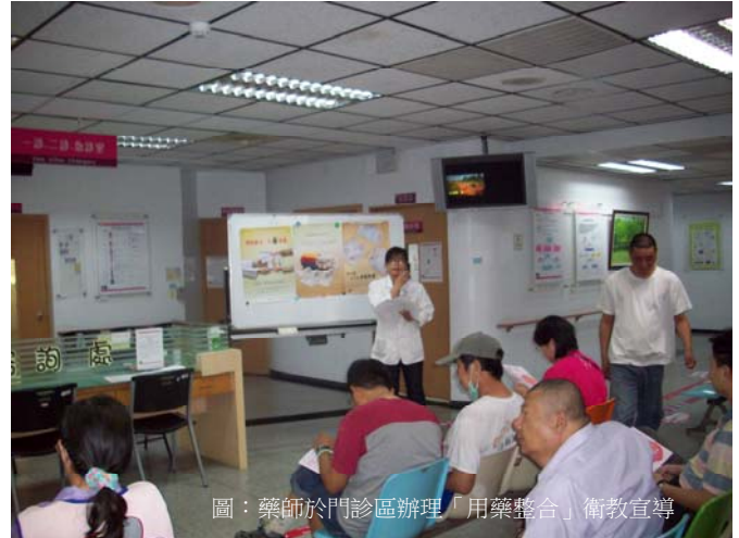
圖：藥師於門診區辦理「用藥整合」衛教宣導