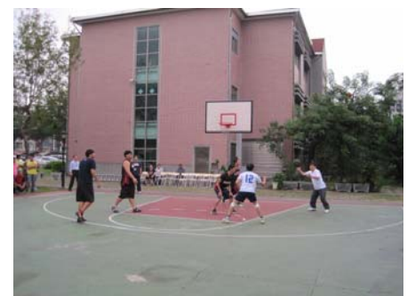
圖：三對三籃球賽院長領軍上陣實況