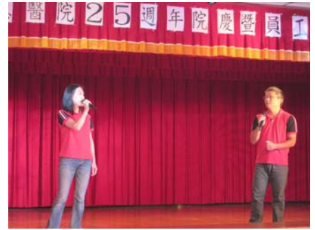
圖：校園民歌賽”宇你相慧”演唱實況

最後，終極加碼 pk 賽壓軸登場，替代役男組隊不愧是灌籃高手，登高一躍進，個個神射手，第一名完勝名符其實。(文/賴素惠專員)