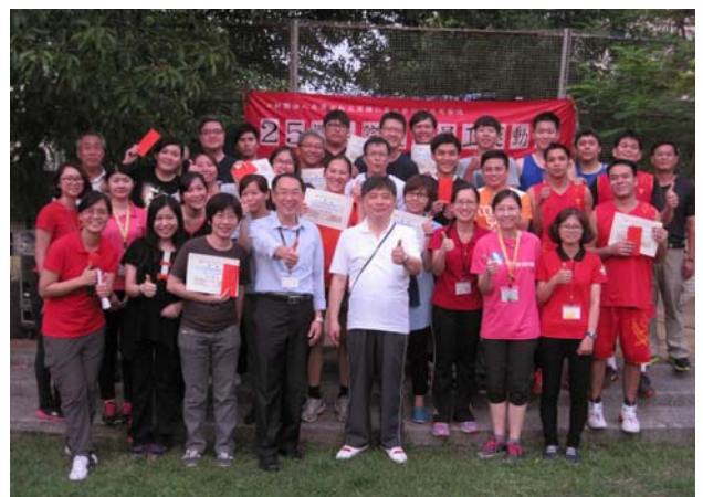
圖：本院 25 週年慶全體大合照