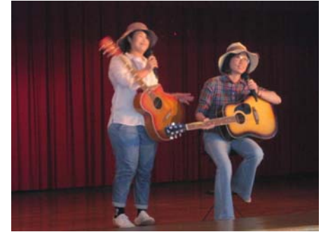
圖：校園民歌賽”梅蘭梅蘭我愛你”演唱實況