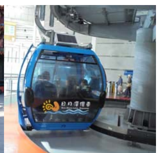
圖：病友搭乘日月潭纜車