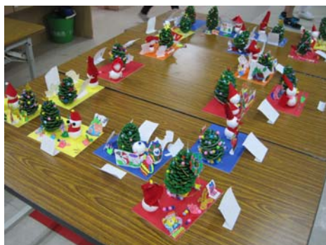
圖：病友製作松果聖誕樹成果展