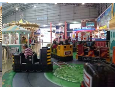
圖：病友搭乘碰碰車實況