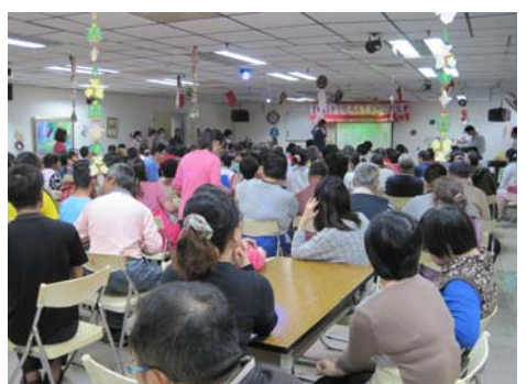
圖：病友卡拉 OK 演唱實況