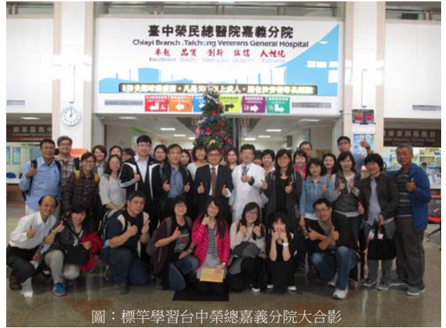
圖：標竿學習台中榮總嘉義分院大合影

感謝醫院與中榮嘉義分院提供這樣的機會，工作人員熱情帶領參觀且不吝於告訴我們作業流程；會議室內詳細的討論說明，各參與人員的積極發言是促成全體共識的第一步。標竿學習圓滿結束了，感謝各位人員的準備及付出，望下次能再有這樣機會讓大家一同參與。(文/職能科 林芊慧職能師)