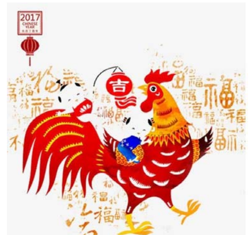
圖： http:// www.jordentown.com/

以上二〇一七年的期待與展望，希望與醫院所有同仁一起努力共勉之。也希望慈惠醫院的院務在雞年能夠雞雞叫，同仁們能夠順利平安。（文/吳景寬院長）