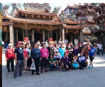
圖：台中鎮瀾宮前大合影