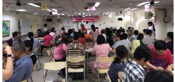
圖：病友製作母親節卡片實況

中，家庭永遠是照護資源最重要的基石，而醫院則是協助讓基石越來越穩固。(文/葉品陽心理師)