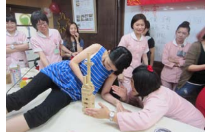
圖：疊疊樂益智遊戲玩得不亦樂乎實況