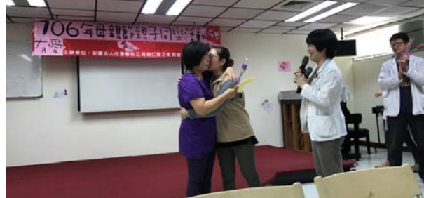
圖：病友送給母親卡片及康乃馨實況

為了讓終年付出的母親能更瞭解治療後的子女，醫院舉辦家屬座談會，增加與母親們的溝通。此外，母親卡製作等活動，更有機會讓子女們表達自己心中的感謝，如同活動主題所提的：有愛大聲說。正所謂愛要及時，讓母親知道自己的付出不是單向，而是雙向互動，同時是子女復健的重要支柱。現場製作卡片中，有患者親筆寫下對母親的感想與愧疚，也期望自己的狀況能越來越好，不要再讓母親更操心。現場更有多位患者當場將卡片送予母親，直接表達自己的感謝與感恩。在全人照護