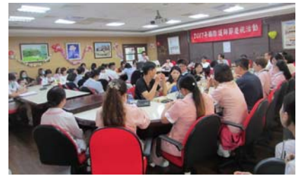
圖：護師節慶祝活動盛況

今年非常感謝護理同仁前往參與，藉由此活動更凝聚大家彼此的感情，雖然護理人員在醫療崗位上扮演一顆小螺絲釘的角色，不論環境如何演變，但只要同心協力，團結力量大，我們可順利完成南丁格爾的使命，只要主管及病人給我們鼓勵與支持，哪怕是一個微笑，一句感謝的話語，有被關懷、被支持、被同理，都將會成為更多的動力朝護理之路走下去。(文/護理部戴韻芳護理師、陳秋蓉護理長)