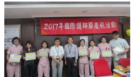
圖：獲頒 105 年護理專業進階人員合影