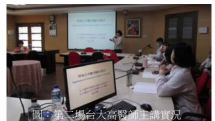
圖：第二場台大高醫師主講實況